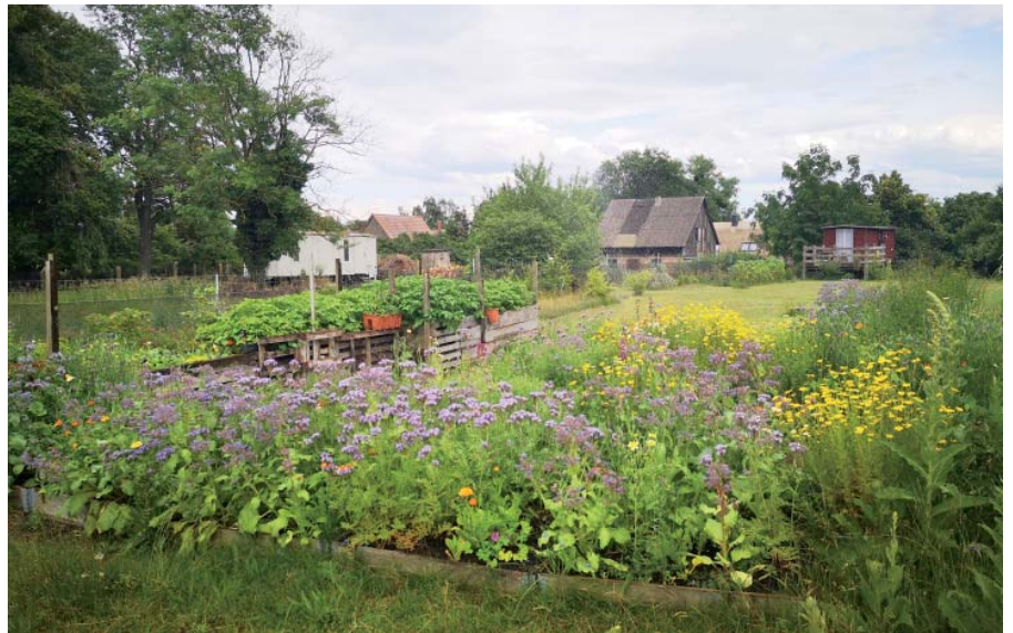
Gemüsekulturen und Blühstreifen als Nahrungsquelle für viele Insektenarten schließen einander keineswegs aus, sondern sind im Garten ein unübersehbarer Blickfang.

Blattsalate und Spargel, aber auch Spinat kommen aus dem Garten als erstes Erntegut frisch in unsere Küche. Im Gewächshaus können die ersten