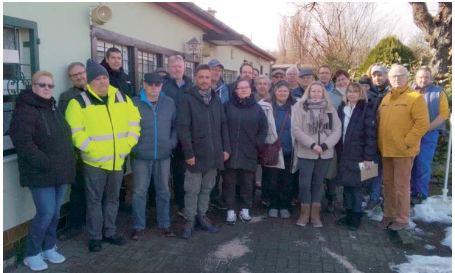
Bei winterlichem Wetter trafen sich über 30 interessierte Gartenfreunde in der KGA „Neues Leben“ Brandenburg/Havel zu einem Gehölzschnittseminar. Der Theorie im Vereinsheim folgte im Projektgarten des Kreisverbandes sozusagen die praktische Anwendung des neuen bzw. aufgefrischten Fachwissens, wobei sich die Zuschauer regelrecht drängelten.

Um das frisch gestärkte Wissen zu festigen, trafen sie sich nach einer kleinen Stärkung im angrenzenden Projektgarten des Kreisverbandes Brandenburg/Havel in direkter Nachbarschaft des Vereinsheimes, denn nur die Übung macht den Meister. Hier befinden sich mehrere Obstbäume, an denen sich die Teilnehmer des Lehrganges unter fachkundiger Betreuung gleich versuchen konnten. Der somit erfolgte Obstbaumschnitt wird sicherlich auch zu besseren Erträgen führen, was die ortsansässige Tafel sicher zu einem späteren Zeitpunkt erfreuen wird. Denn diese Kleingartenparzelle befindet sich in einer Kooperation mit einem freien Träger, welcher mit Unterstützung des Jobcenters regelmäßig Personal akquirieren kann, um die Teilnehmer auf eine Teilhabe am Berufsleben