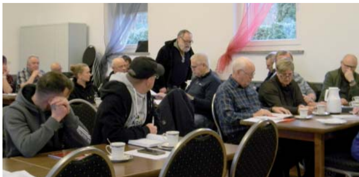
In der Diskussion der 29 Vereinsvertreter ging es am 1. Februar im Vereinsheim „Zur Guten Hoffnung“ auch um den Umgang mit Bauanträgen.