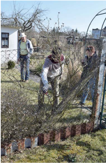
Auch der Rosenstock am Eingang zum Vereinsgarten wurde in Schuss gebracht.