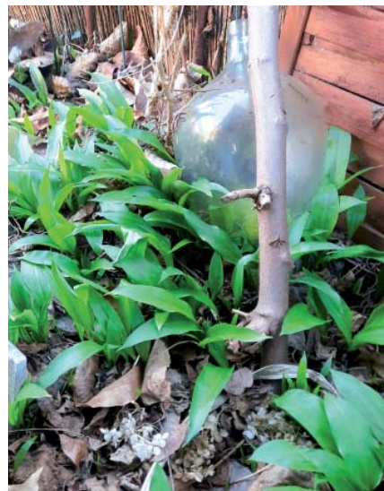
Eine kleine Ecke für Bärlauch lässt sich in jedem Kleingarten finden.

„Ich denke, das soll ein Gewächshaus werden und kein Keller“, mosert meine Gartennachbarin. „Das soll ein Walipini, ein Erdgewächshaus werden“, klärt meine Tochter auf.