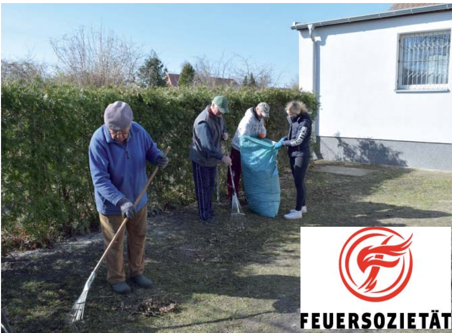
Selbst bei einfachen Pflegearbeiten an den Gemeinschaftseinrichtungen einer Kleingartenanlage kann sich schnell ein Arbeitsunfall ereignen, weshalb man besser vorsorgen sollte.

Unfälle sind immer schlimm, aber leider manchmal nicht vermeidbar. Aus diesem Grund ist es wichtig, für die Pächter, die in ihrer Freizeit an Arbeitseinsätzen teilnehmen, solch eine sinnvolle Versicherung abzuschließen. Dies kann der einzelne Kleingärtnerverein, der jeweilige Kreis- bzw.