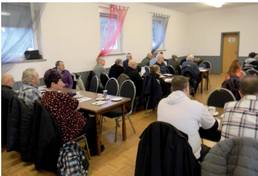
Die Vertreter der Mitgliedsvereine des Regionalverbandes Fürstenwalde treffen sich bereits am 10. Mai 2025 erneut – dann zur Wahl eines neuen Verbandsvorstandes.

„Anfeindungen einzelner Kleingärtner gegenüber dem Verband, er würde die Probleme der Kleingärtner nicht ernst nehmen, oder Aufrufe zu Demonstrationen sind in dieser Verhandlungsphase wenig hilfreich, denn als Gartenfreunde sollten wir gemeinsam für unsere Interessen einstehen“, betonte Vorsitzender Kurzhals. Diesem Ziel dient letztlich auch die für den 10. Mai 2025 eingetragene Mitglieder- und Wahlversammlung des Regionalverbandes, bei der dessen Vorstand neu gewählt werden soll. Andreas Laube, ps