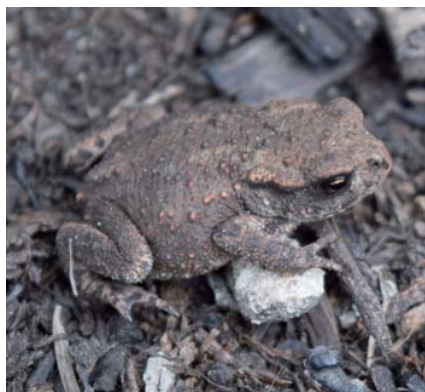
Frösche und Kröten lieben die Feuchte auf dem Mulchmaterial und nutzen Totholzhaufen als Unterschlupf und Versteck.

nächsten Jahr in voller Pracht erstrahlen, sollten sie jetzt ausgelichtet werden. Die ältesten Äste bodennah entfernen, damit sich die jungen Triebe im nächsten Jahr besser entwickeln.