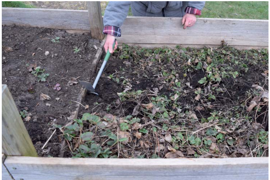
Nun ist es aber höchste Zeit, die Hochbeete in Ordnung zu bringen. Beikräuter und Pflanzenreste werden entfernt sowie die Höhenunterschiede mit frischem Substrat ausgeglichen.

getes, Kapuzinerkresse, Kornblumen, Löwenmäulchen, Mohn, Prunkwinde, Ringelblume, Schleierkraut und Astern ;